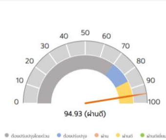
ผลการประเมินในภาพรวม